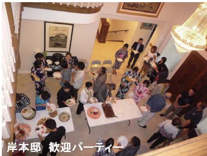
岸本邸 歓迎パーティー