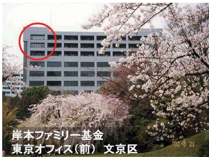
岸本ファミリー基金 東京オフィス(前) 文京区