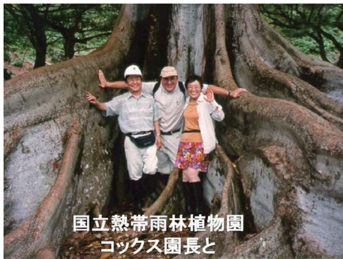
国立熱帯雨林植物園 コックス園長と