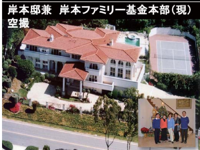
岸本邸兼 岸本ファミリー基金本部(現) 空撮