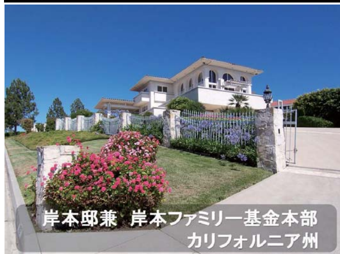
岸本邸兼 岸本ファミリー基金本部 カリフォルニア州