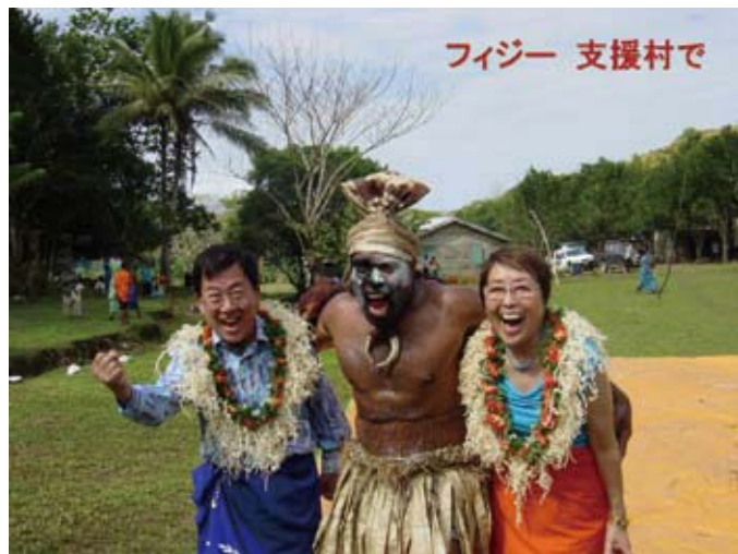
フィジー 支援村で