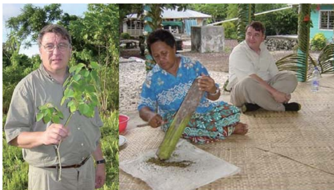
生涯のメンター エイズ薬学者 コックス博士