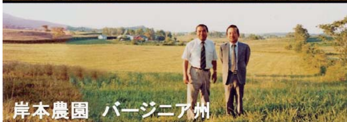
岸本農園 バージニア州