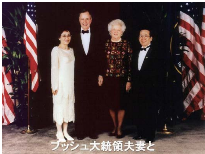
ブッシュ大統領夫妻と