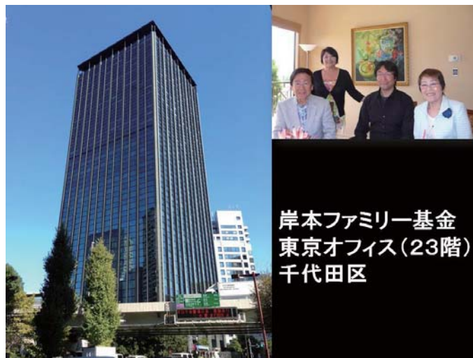
岸本ファミリー基金 東京オフィス(23階) 千代田区