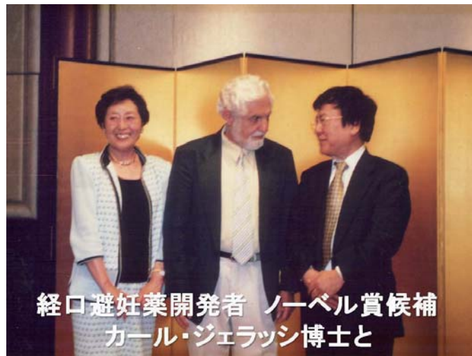
経口避妊薬開発者 ノーベル賞候補 カール・ジェラッシ博士と