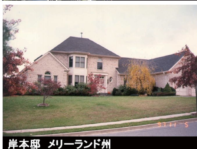
岸本邸 メリーランド州