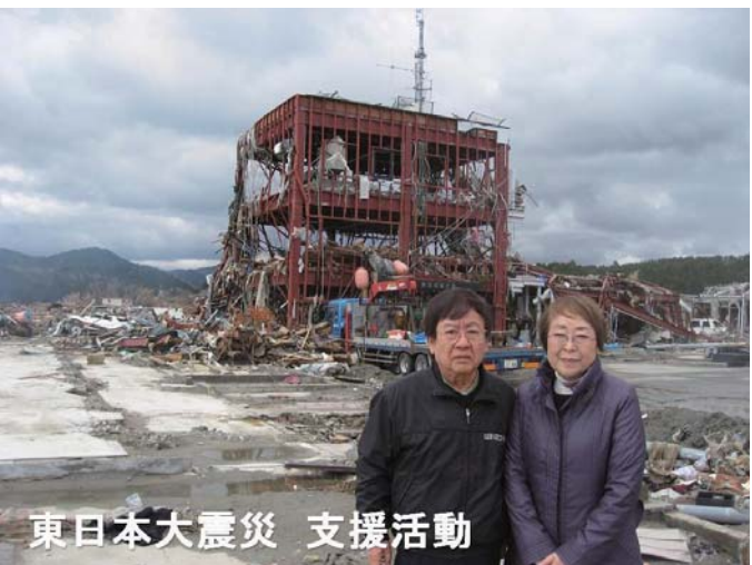
東日本大震災 支援活動