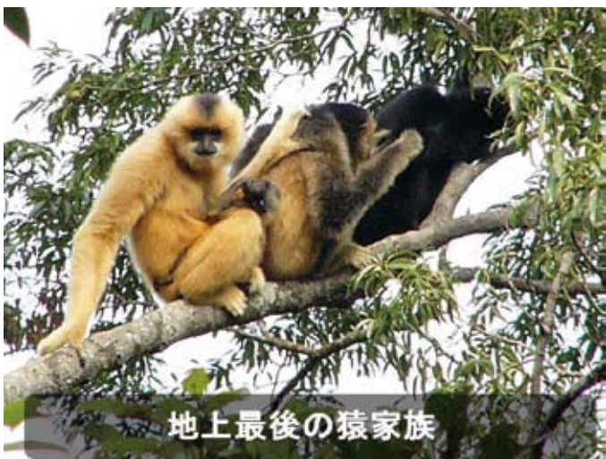
地上最後の猿家族